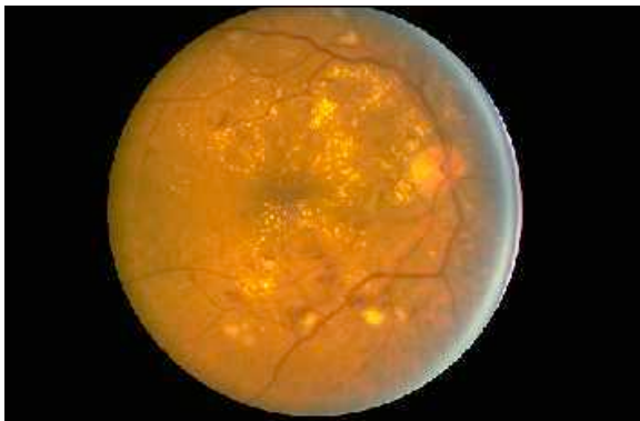
Fondo de Ojo con Retinopatía Diabética